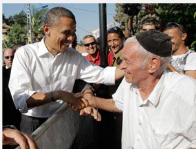
Barack Obama cumprimentando moradores de Sderot, Israel, 23-jul-08