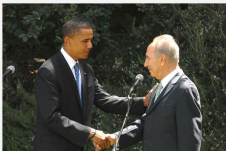
Barack Obama cumprimenta Shimon Peres em Israel, em campanha presidencial, 23-jul-08