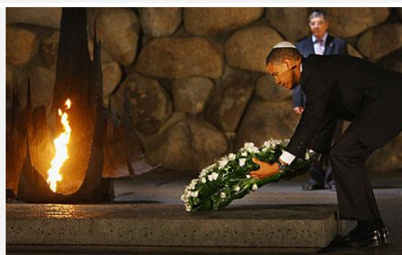
Barack Obama colocando uma coroa na sala do Museu do Holocausto Yad Vashem, em Jerusalém, 23-jul-08

Veja a matéria referente a esta visita de Barack Obama em campanha eleitoral a Israel em 2008 na seguinte matéria abaixo: Obama encontra líderes-chave em Israel e territórios palestinos no Estadão.com