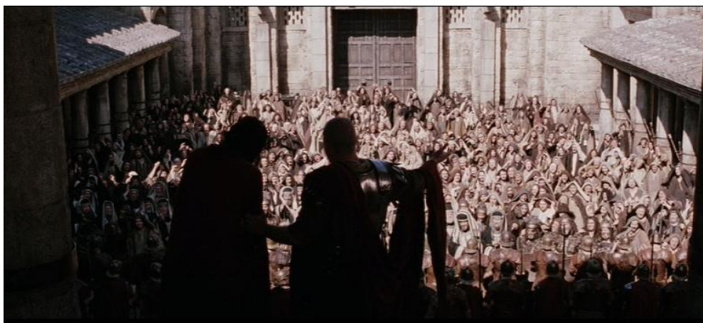
A encenação de Pilatos perguntando aos judeus: "HEI DE CRUCIFICAR O VOSSO REI?" responderam, os principais sacerdotes: "NÃO TEMOS REI, SENÃO CÉSAR." João 19:15

Tibério César era o imperador supremo do Império Romano, ou seja, o " grande líder mundial " da época, pois o império romano dominava quase todo o mundo da época, inclusive Israel, que era uma província do Império Romano. Da mesma forma que os judeus declararam César " como rei ", eles estão fazendo o mesmo ao declarar Barack Obama como " grande líder " para o mundo e para Israel, como fez Shimon Peres na declaração ao presidente americano.