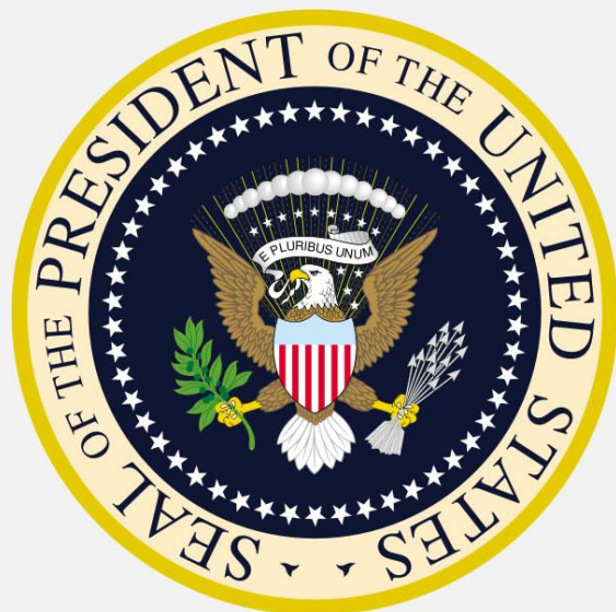
O símbolo da águia no "Selo Presidencial" dos EUA

RESPOSTA: ESTADOS UNIDOS DA AMÉRICA! - É esta a nação que viria contra Israel! - Tanto é, que os Estados Unidos da América tem como símbolo " uma águia " em um brasão chamado de " Grande Selo " (Wikipedia). A águia também está presente no " Selo Presidencial Americano " como podemos ver abaixo: