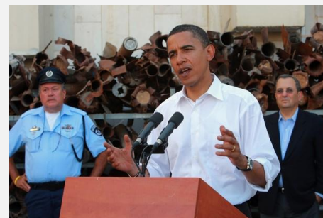
Barack Obama em Sderot, em um discurso onde ele promete "paz duradoura" para Israel, 23-jul-08