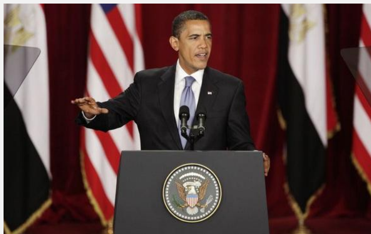
Barack Obama em discurso no Cairo, Egito, com destaque para o " símbolo da águia " no Selo Presidencial dos EUA