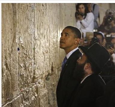
Barack Obama no Muro das Lamentações, 23-jul-08