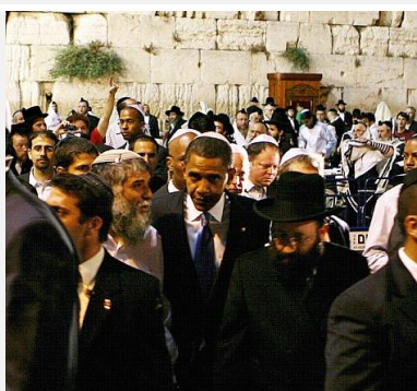
Barack Obama em Jerusalém, em visita ao Muro das Lamentações, 23-jul-08